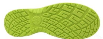
Suela Antiestática + Resistente a los hidrocarburos