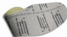
Plantilla anti-perforación flexible