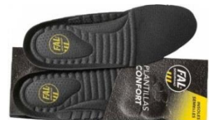
Plantillas extraíbles. Lavables