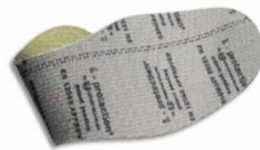
Plantilla anti-perforación flexible