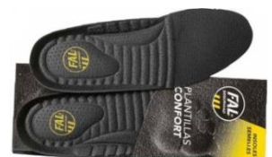
Plantillas extraíbles. Lavables