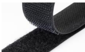
Cierre de Velcro