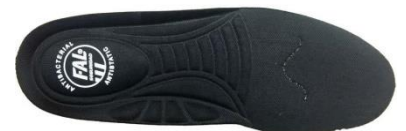
Plantilla extraíble comfortable