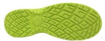
Suela Antiestática + Resistente a los hidrocarburos