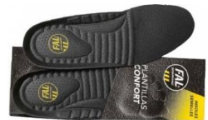
Plantillas extraíbles. Lavables