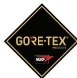
Membrana del forro impermeable + transpirable