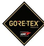
Membrana del forro impermeable + transpirable