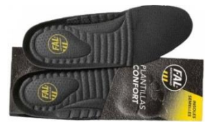
Plantillas extraíbles. Lavables