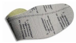
Plantilla anti-perforación flexible