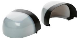
Puntera no metálica