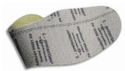
Plantilla anti-perforación flexible