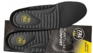
Plantillas extraíbles. Lavables