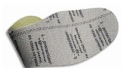
Plantilla anti-perforación flexible