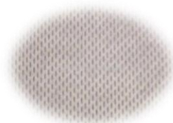
Forro resistente a la abrasión