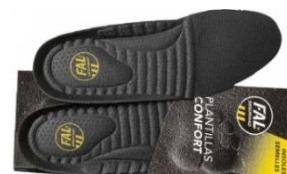
Plantillas extraíbles. Lavables