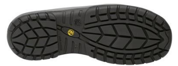
Suela Antiestática + Resistente a los hidrocarburos