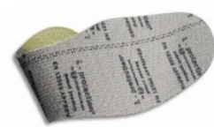
Plantilla anti-perforación flexible