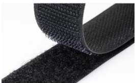
Tira de Velcro