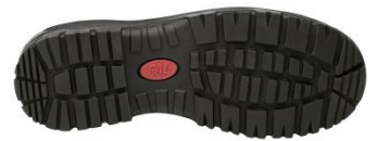
Suela antiestática, resistente a los hidrocarburos y al calor