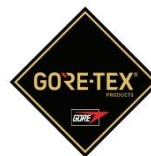
Membrana del forro impermeable + transpirable