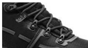
Ganchos reforzados no metálicos