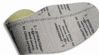
Plantilla anti-perforación flexible