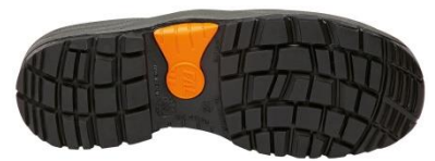
Suela Antiestática + Resistente a los hidrocarburos