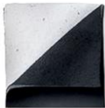
Forro resistente al frío Thinsulate