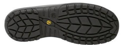
Suela Antiestática + Resistente a los hidrocarburos