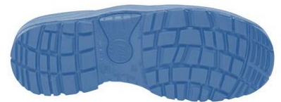
Suela Antiestática + Resistente a los hidrocarburos