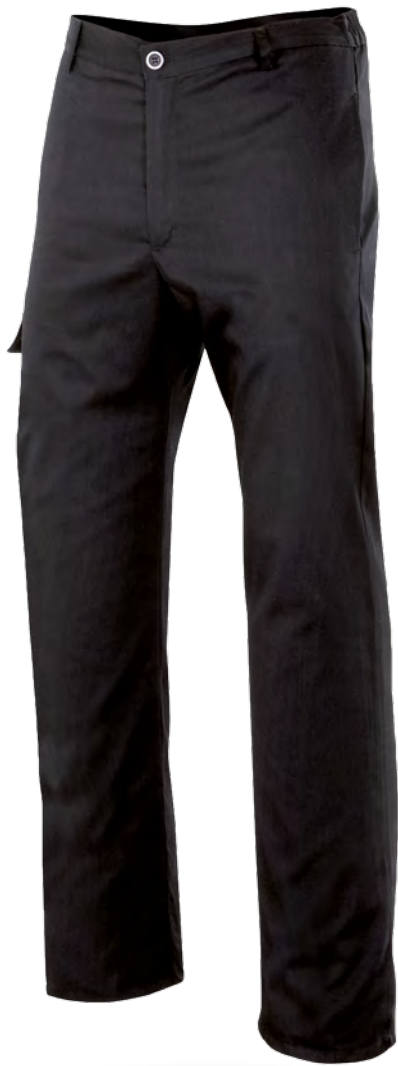
ORÉGANO 00 Pantalón de cocina