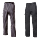
ORÉGANO 52 Pantalón de cocina cuadros