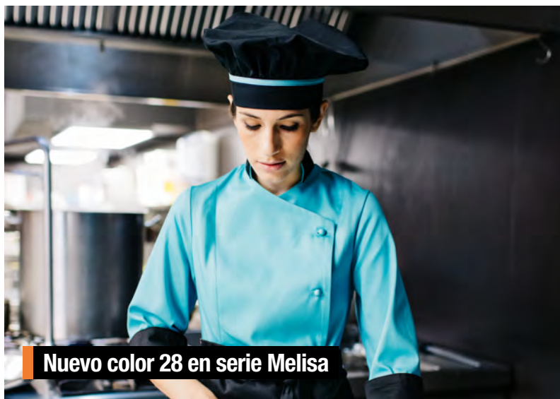
Nuevo color 28 en serie Melisa

Descubre las diferentes posibilidades de personalización que ofrecemos tanto en ropa de cocina como en ropa de sala.