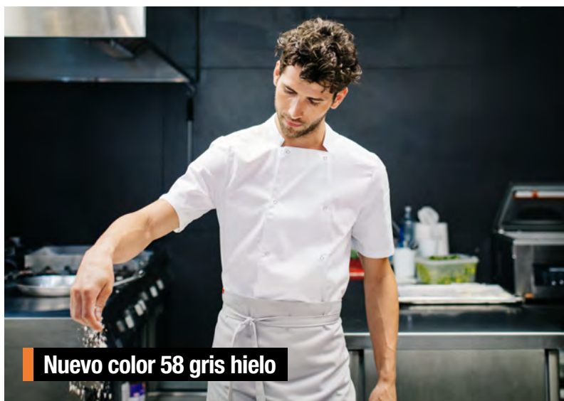
Nuevo color 58 gris hielo