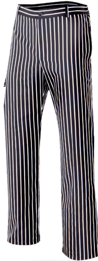
ORÉGANO 50 Pantalón de cocina rayas