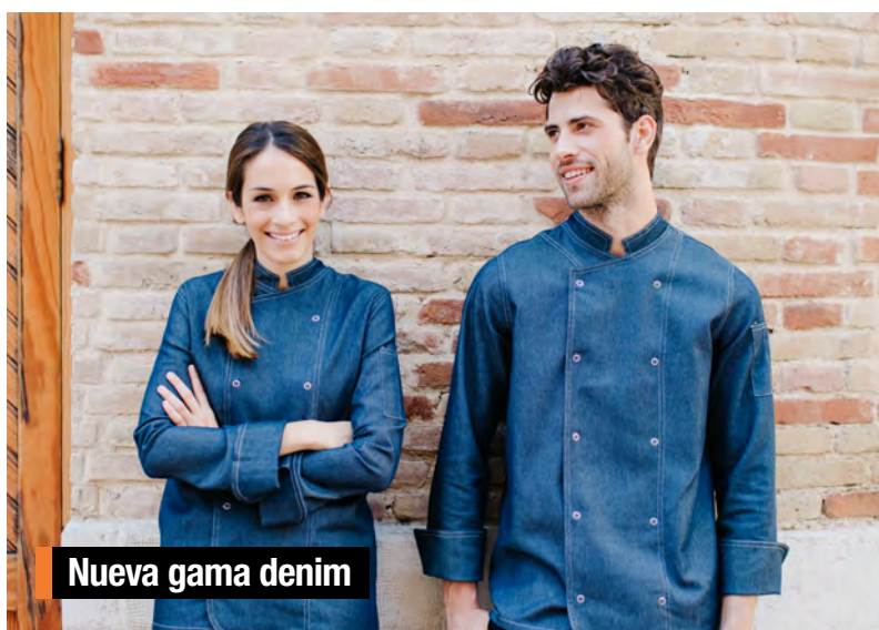
Nueva gama denim