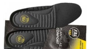
Plantillas extraíbles. Lavable