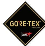
Membrana del forro impermeable + transpirable