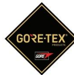
Membrana del forro impermeable + transpirable