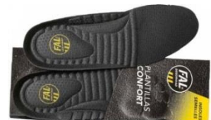
Plantillas extraíbles. Lavable