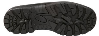
Suela confortable de poliuretano