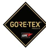
Membrana del forro impermeable + transpirable